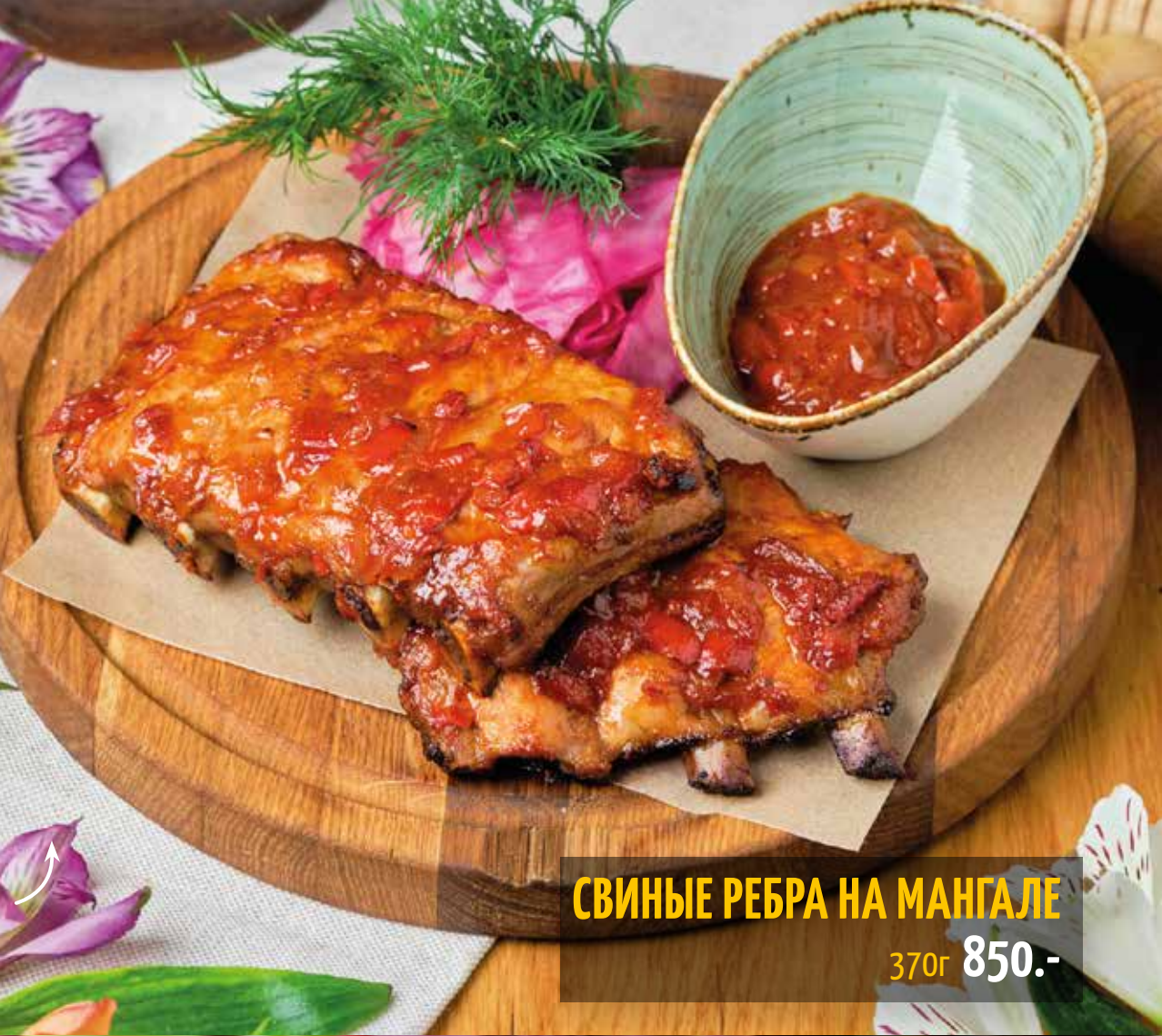
СВИНЫЕ РЕБРА НА МАНГАЛЕ 370г 850.-