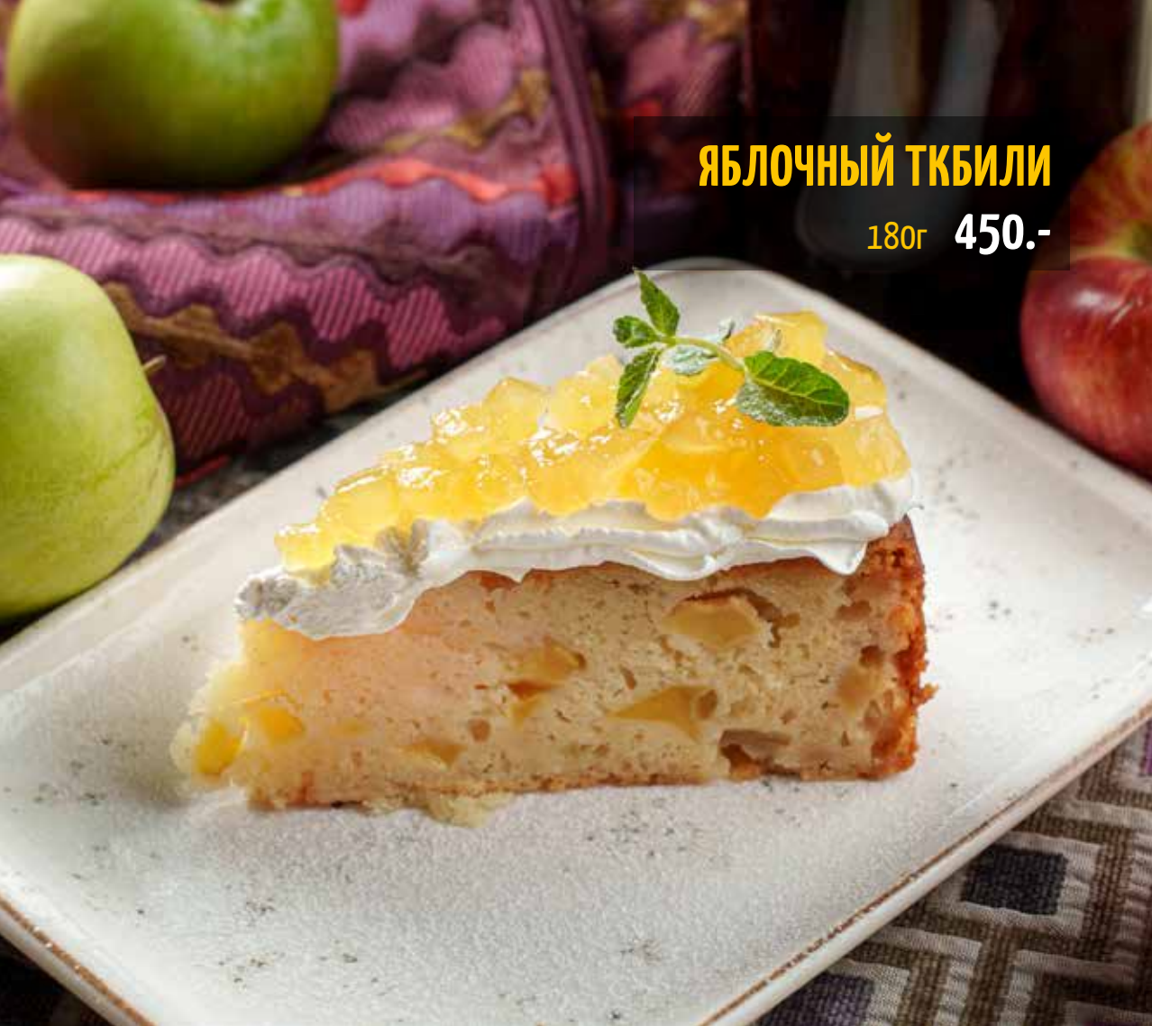
ЯБЛОЧНЫЙ ТКБИЛИ 180г 450.-